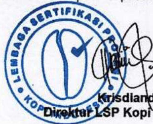
Krisdiandi Direktur LSP Kopi Indonesia